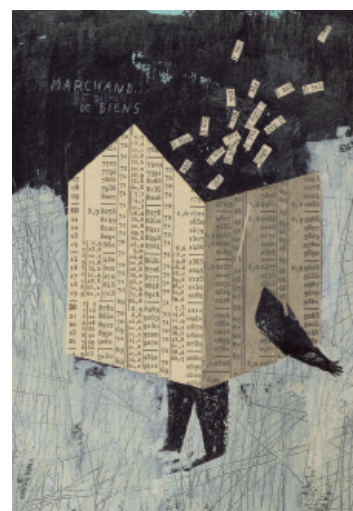
Marchand de biens , technique mixte, 33x25 cm © Frédérique Bertrand, 2012