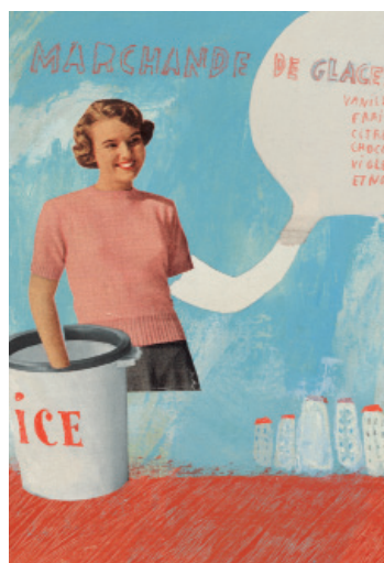
Marchande de glaces , technique mixte, 33x25 cm © Frédérique Bertrand, 2012