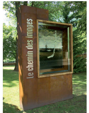
Vitrine du Chemin des Images en 2009 avec une œuvre de Teun Hocks