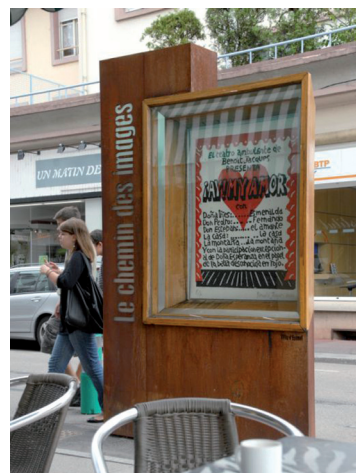
Vitrine du Chemin des Images en 2010, avec une œuvre de Benoît Jacques