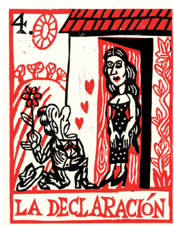
La declaración , linogravure 2 couleurs, 13x18 cm © Benoît Jacques, 2010