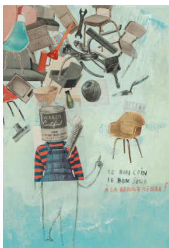
Le bon coin | le bon jour | à la bonne heure , technique mixte, 33x25 cm © Frédérique Bertrand, 2012

Les visuels présentés dans ce dossier sont tous libres de droits et disponibles en 300 dpi