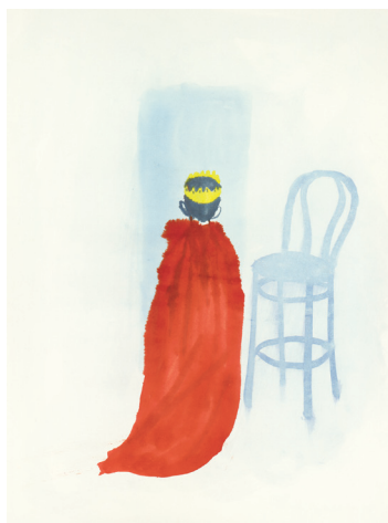
Petit king , encres sur papier, 45x61 cm © Loren Capelli, 2011

En 2011, Loren Capelli s'est inspiré d'anecdotes, de photographies, de souvenirs pour donner naissance en peinture à une émouvante galerie de portraits. Dans les sillons de l'enfance, Loren Capelli nous entraînait dans une réflexion sur l'identité. Les promeneurs se sont laissés prendre au jeu en compagnie de ces quinze images... Une parenthèse de poésie dans un monde en mouvement.