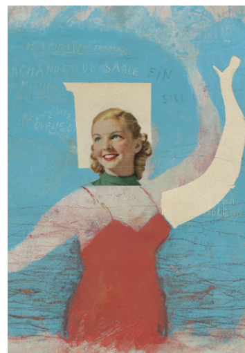
Marchande de sable , technique mixte, 33x25 cm © Frédérique Bertrand, 2012

Conservatrice du Musée de l'Image | Ville d'Épinal