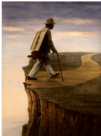
Untitled , photographie rehaussée, 159x120 cm © Teun Hocks, 1999