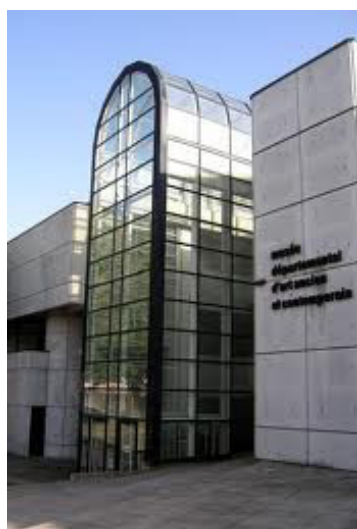
Le Musée départemental d'art ancien et contemporain

L'exposition Rois & reines vous invite à une aventure historique , en compagnie des souverains français. Rois et reines d'image – réalité ou légende – grande Histoire et petites histoires... En compagnie d'historiens passionnés et des images de Frédéric Coché, regards contemporains et (souvent) amusés sur des images d'hier.