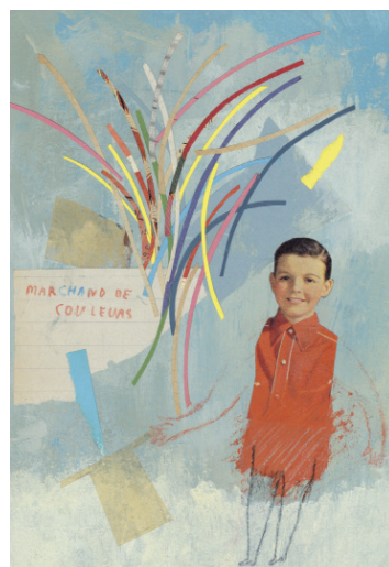
Marchand de couleurs , technique mixte, 33x25 cm © Frédérique Bertrand, 2012