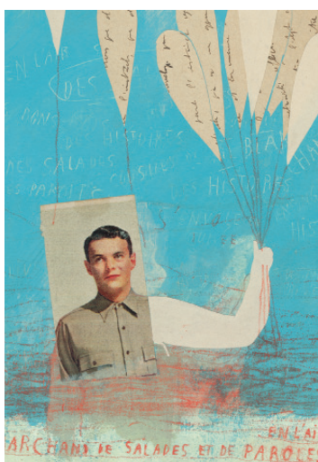
Marchand de salades et de paroles en l'air , technique mixte, 33x25 cm © Frédérique Bertrand, 2012