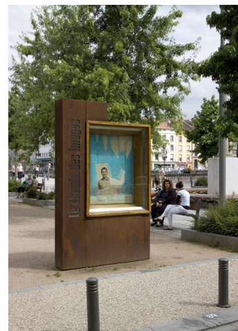
Une vitrine Place Pinau, « Le marchand de salades et de paroles en l'air ».