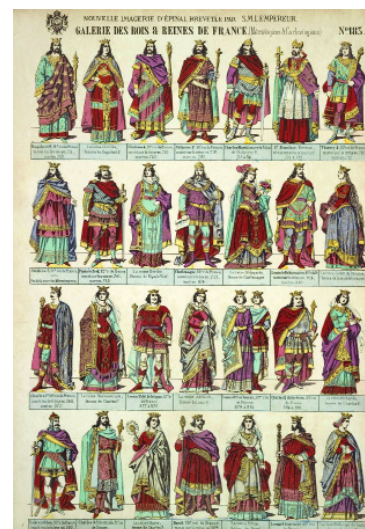
GALERIE DES ROIS & REINES DE FRANCE Lithographie coloriée au pochoir | 1867 Pinot et Sagaire, Épinal. Coll. Musée de l'Image, dépôt MDAAC