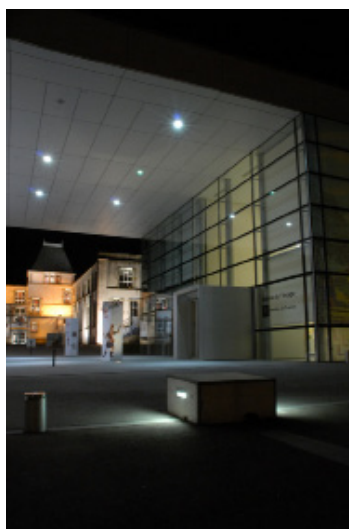
Le Musée de l'Image | Ville d'Épinal